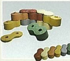
リサイクルゴムレンガ