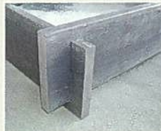
リサイクルウッド