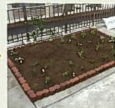
水菜、チンゲン菜、バジル、 タイムなどの菜園の完成