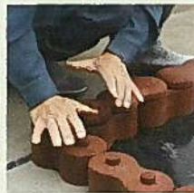
リサイクルゴムレンガの フレームを組む。