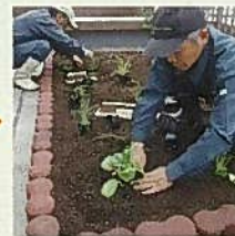
十分な間隔を空けて 野菜の苗を植え付ける。