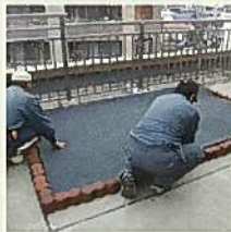
耐根シートの上に 保護マットを敷く。