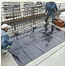
コンクリートを傷めない 為に耐根シート設置