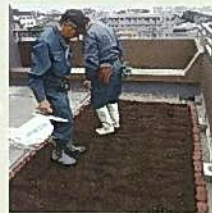
特殊軽量土壌「空の土」 を入れる。